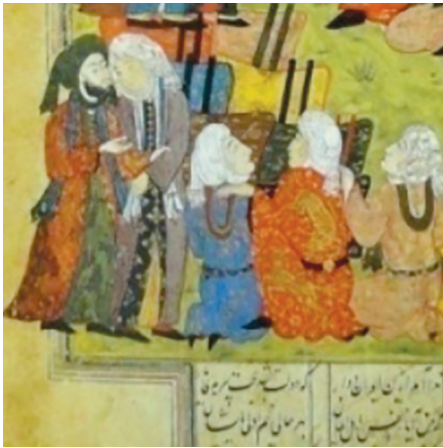
(تصویر ۷) بخشی از تصویر ۵

(تصویر ۷) این نگاره با توجه به اشعاری که در حاشیه بالایی و پایینی آن به‌ویژه با حدیث ولایت «من كنت مولاه فهذا...» و حکم الهی کتابت‌شده، تناسب دارد. این تصویر علاوه بر نمایش ماجرای غدیر خم، مبین نص الهی درباره جانشینی حضرت علی (علیه السلام) است. در این نگاره با توجه به پرسپکتیو مقامی حضرت رسول ﷺ و امیرالمومنین علی (علیه السلام) نسبت به دیگران بالاتر ترسیم شده‌اند که نشانه جایگاه و مقام والای ایشان است.