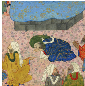
(تصویر ۳) بخشی از تصویر ۱