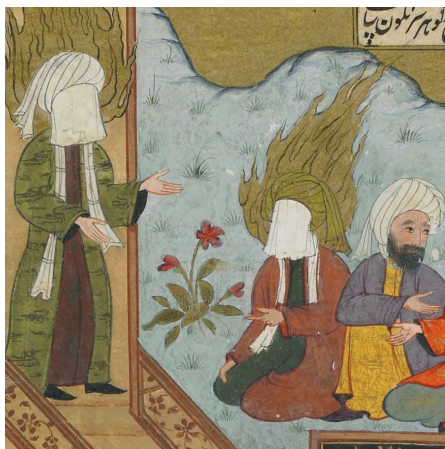
(تصویر ۱۳) بخشی از تصویر ۱۱

در این نگاره نیز امام علی (علیه السلام) بالاتر از دیگران و نزدیک‌تر به رسول الله (صلی الله علیه و آله) ترسیم شده‌اند. ایشان نیز با عمامه سبزرنگ و روبند و هاله شعله‌سان همچون پیامبر اکرم (صلی الله علیه و آله) به نمایش درآمده‌اند. (تصویر ۱۳) ترسیم ایشان پایین‌تر از پیامبر (صلی الله علیه و آله) و بالاتر از بقیه حضار، علاوه بر اینکه مبین عظمت مقام و جایگاه ایشان است، نشانه تقرب و نزدیکی نزد حضرت رسول (صلی الله علیه و آله) است. حضرت علی (علیه السلام) پس از پیامبر (صلی الله علیه و آله) مهم‌ترین فرد جامعه اسلامی و نزدیک‌ترین فرد به پیامبر (صلی الله علیه و آله) و به لحاظ قرب الی الله دومین فرد در پیشگاه الهی است. حضاری که در پای منبر پیامبر (صلی الله علیه و آله) نشسته‌اند، در حال گفت‌وگو با یکدیگرند. احتمالاً آن‌ها بعد از شنیدن سخنان پیامبر (صلی الله علیه و آله) درباره جنگ خندق و دلآوری‌های امام علی (علیه السلام) راجع به این موضوع در حال گفت‌وگو هستند. نکته حائز اهمیت این است که منبر بر خلاف اشعار نگاره که اشاره به مسجد دارد، در فضای باز و در دامنه تپه‌ها ترسیم شده است که احتمالاً به مسجد ساده و اولیه نبی اکرم (صلی الله علیه و آله) در مدینه اشاره دارد.