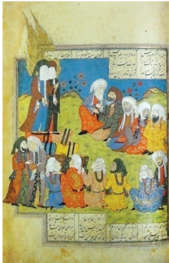
تصویر ۵. نگاره «غدیر خم»

در این نگاره به خیل عظیم حجاج که در حال بازگشت از حج هستند، اشاره‌ای نشده است و افراد به صورت دوردیف موازی در دو طرف منبر نشسته‌اند و زن و مردی نیز در حال گفت‌وگو ایستاده‌اند. بخشی از تصویر ۱ همه افراد اعم از پیر و جوان که با محاسن سیاه و سفید از هم متمایز شده‌اند، همگی دارای دستار هستند و با لباس‌هایی که برگرفته از طراحی و پوشاک دوران صفوی است، به تصویر درآمده‌اند. برخی افراد به سخنان پیامبر (صلی الله علیه و آله) توجه دارند، ولی عده‌ای نیز با یکدیگر در حال گفت‌وگو هستند و احتمالاً این رخداد مهم را با یکدیگر تحلیل می‌کنند. ترسیم یک زن در این تصویر اشاره‌ای به حضور زنان در مراسم حجه‌الوداع دارد.