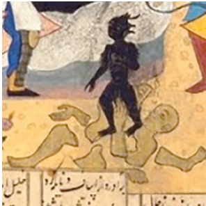
(تصویر ۱۶) بخشی از تصویر ۱۴ (تصویر ۱۷) بخشی از تصویر ۱۴