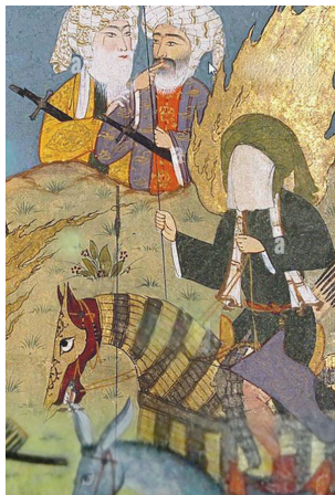
(تصویر ۱۰) بخشی از تصویر ۸

است. (تصویر ۱۰) در کنار ایشان نیز اسبی بدون سوار وجود دارد که احتمالاً اسب امام علی (علیه السلام) است. در دست راست پیامبر (صلی الله علیه و آله) علم و بیرقی وجود دارد که ظاهراً پرچم آن مشاهده نمی‌گردد، ولی نوک آن از کادر نگاره خارج شده است. احتمالاً کتیبه‌های اشعار فوقانی نگاره روی آن کتابت و مانع از نمایش آن شده‌اند. بر اساس «حدیث رایت» حضرت علی (علیه السلام) که علم‌دار این جنگ هستند، احتمالاً در حین حمله به سمت دژ خیبر، بیرق را به دست پیامبر (صلی الله علیه و آله) داده‌اند. در فتح خیبر حضرت رسول (صلی الله علیه و آله) فرمود: «لاعطین رایة عدار جلا یحب الله ورسوله (و یحبه الله ورسوله) یفتح الله علی یدیہ لیس بفرار» حدیث رایت در اکثر کتاب‌های حدیثی و تاریخی شیعی و سنی آمده و به حد تواتر رسیده است. این حدیث از دلایل استوار تقدم و افضلیت علی (علیه السلام) بر سایر صحابه است. ۱۶ معمولاً رایت [پرچم] به سرداری سپرده می‌شود که استعداد نظامی و نیروی بدنی و هوش و استقامت و سرعت عمل و معنویات او از دیگران بیشتر باشد و تا آخرین نفس برای برپا داشتن آن مقاومت و فداکاری نماید. رایت پیامبر (صلی الله علیه و آله) در همه غزوات به دست علی (علیه السلام) بود (امین، ج ۳۳۷: ۱) انس بن مالک و جابر بن عبدالله انصاری از رسول الله (صلی الله علیه و آله) روایت کرده‌اند که «علی پسر عم و حامل رایت من است». ۱۷