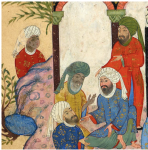
(تصویر ۴) بخشی از تصویر ۱

جریان گم‌شدن رسول خدا (ص) در مکه این‌گونه نقل شده که چون حلیمه آن حضرت (ص) را به مکه آورد تا به مادر و جدش بسپارد در میان کوچه‌های مکه او را گم کرد و هر چه این طرف و آن طرف جست‌وجو کرد، او را نیافت و سراسیمه به نزد جدش عبدالمطلب (ص) آمد و جریان را به او اطلاع داد. حضرت عبدالمطلب (ص) از جا برخاست و به کنار خانه کعبه آمد و با تضرع و زاری پیدا شدن فرزندش محمد را از خدای تعالی خواستار شد و اشعاری که از وی در این باره نقل شده، کمال علاقه او را به فرزند و پیدا شدن او می‌رساند. ۱۲ به دنبال آن قبایل قریش، خاندان بنی‌هاشم و بنی‌غالب را برای یافتن فرزند به یاری طلبید و غوغایی در مکه برپا شد، تا اینکه ورقه بن نوفل و مرد دیگری از قریش آن جناب را پیدا کرده و به نزد عبدالمطلب (ص) آورده و گفتند: ما او را در بالای شهر مکه پیدا کردیم (رسولی محلاتی، ۱۳۹۱: ۶۸-۶۷).