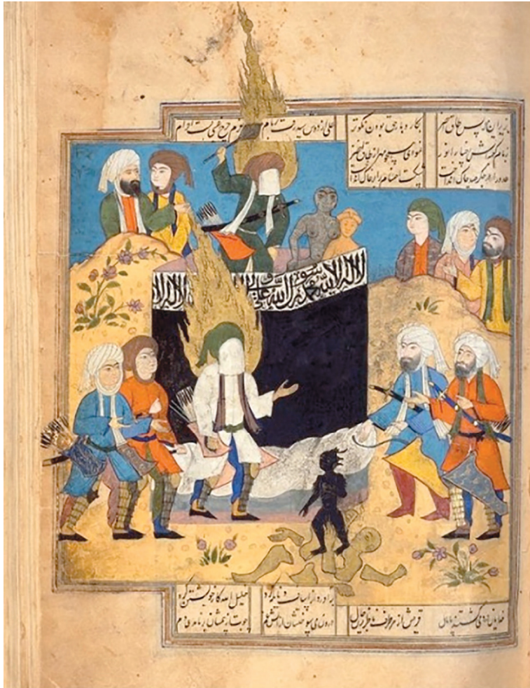
تصویر ۱۴. نگاره «فتح مکه»

در نگاره «فتح مکه» (تصویر ۱۴) کعبه در مرکز تصویر با کسوه‌ای سیاه‌رنگ که در قسمت فوقانی آن کتیبه‌ای از شهادتین شیعی وجود دارد، ترسیم شده است. بر پشت بام کعبه حضرت علی (علیه السلام) با عصایی که در دست دارد، بت‌هایی را که در آن مکان قرار دارد،