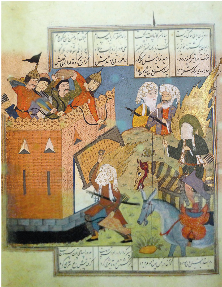
تصویر ۸. نگاره «فتح خیبر»