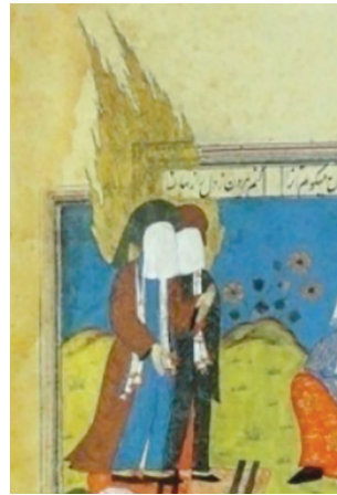
(تصویر ۶) بخشی از تصویر ۵

طبق حدیث متواتر غدیر، در روز ۱۸ ذی الحجه سال دهم هجرت بر پیامبر ﷺ وحی شد که دین بدون ابلاغ پیام ولایت امیرالمومنین علی (علیه السلام) کامل نمی‌شود. ۱۴ بسیاری از روایات که نزول آیه اكمال دین را روز غدیر معرفی می‌کنند، ۱۵ یادآور می‌شوند که پیامبر ﷺ پس از نصب علی (علیه السلام) برای خلافت چنین فرمود: «سپاس خداوندی را بر تکمیل آیین و اتمام نعمت و رضایت او بر رسالت من و ولایت علی (علیه السلام) پس از من» (امینی، ۱۳۷۸، ج ۱: ۱۱۲)؛ بنابراین، امامت، استمرار نبوت و لطفی از جانب خدای متعال است. امامت جز با تصریح خداوندی تحقق نمی‌پذیرد و مردم در تعیین امام معصوم نقش ندارند. امامت یکی از اصول بنیادی دین