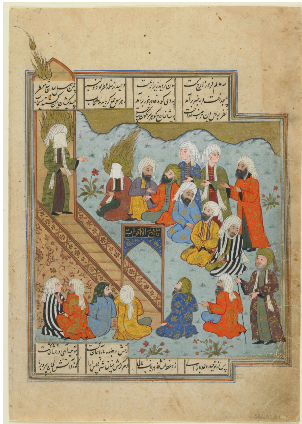
تصویر ۱۱. نگاره «سخنرانی پیامبر (ص) بعد از جنگ خندق»

در نگاره «سخنرانی پیامبر (ص) بعد از جنگ خندق» (تصویر ۱۱) پیامبر (ص) با عمامه و روبند سپید و هاله شعله‌سان در حال ایراد خطبه بر روی منبری هستند که در محراب قرار دارد. (تصویر ۱۲) بر فراز ورودی منبر کتیبه‌ای با عبارت «یا مفتح الابواب» مشاهده می‌شود. بر