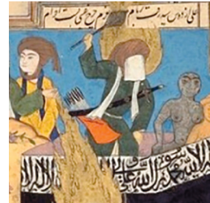
(تصویر ۱۵) بخشی از تصویر ۱۴

نمایش حضرت علی (علیه السلام) روی کعبه و در پشت سر پیامبر (صلی الله علیه و آله) می‌تواند اشاره‌ای بر آیه «انذار» در روز یوم الدار هم باشد که پیامبر (صلی الله علیه و آله) دست خود را بر سینه گذاشت و فرمود: «من منذرکم و برای هر قومی هادی است. آن گاه اشاره به شأنه علی نمود و فرمود: تنها به واسطه تو است که هدایت شوندگان، بعد از من هدایت می‌گردند» (حاکم حسکانی، ۱۴۱۱ق، ج: ۱، ۳۸۱).