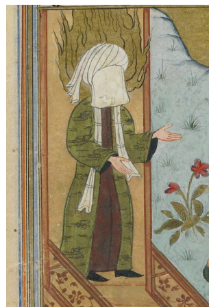
(تصویر ۱۲) بخشی از تصویر ۱۱