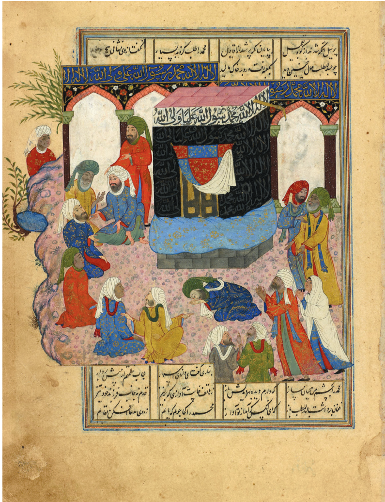
تصویر ۱. نگاره «حضرت عبدالمطلب (علیه السلام) در کعبه نماز می‌خواند»

حلیمه خاتون است. در سمت چپ و قسمت فوقانی کعبه نیز یک نفر، احتمالاً ورقه بن نوفل یا فرد دیگری، در حال گفت‌وگو با پسر بچه‌ای است که زیر درختی، خارج از کادر نگاره، ترسیم شده که حضرت محمد (صلی الله علیه و آله) هستند (تصویر ۴).