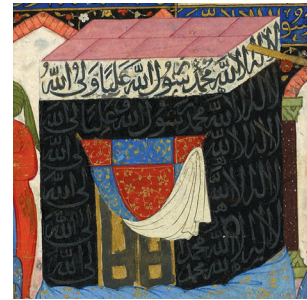
(تصویر ۲) بخشی از تصویر ۱

در این نگاره، روی پرده مکه کتیبه‌ای از شهادتین شیعی مشاهده می‌شود که احتمالاً به دلیل زمان ترسیم آن، دوره صفویه است. نگارگر یا سفارش‌دهنده این نسخه خواسته است به این طریق نشان دهد که حضرت عبدالمطلب (ص) بر دین حنیف و الهی بوده و دین حضرت رسول خدا (ص) و علی (ص) در امتداد دین حضرت ابراهیم (ص) است. امام صادق (ص) می‌فرماید: «پیامبر (ص) به علی (ص) فرمود: عبدالمطلب هیچ‌گاه قمار بازی نکرد و بت نپرستید و... و می‌گفت: من بر دین پدرم، ابراهیم، هستم» (ابن بابویه، ۱۳۶۲، ج ۱: ۴۵۵).